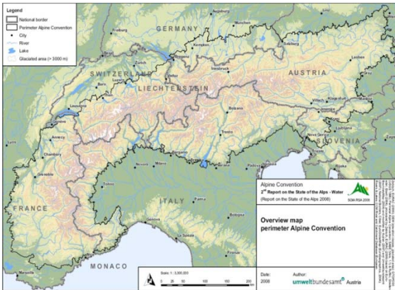
محيط إتفاقية جبال الألب

190.959 كلم مربعا أو 73.730 ميلا مربعا، وتضم 5867 بلدية (البيانات منذ كانون الثاني 2008). وتمتد جبال الألب بناء لما هو محدّد في الإتفاقية الألبية على مساحة 1200 كلم أو 746 ميلا، عبر ثمانى ولايات. يبلغ عرضها 300 كلم أو 186 ميلا كحد أقصى بين بفاريا وشمال إيطاليا. وتتضمن الإتفاقية مناطق موناكو وليشتنستين