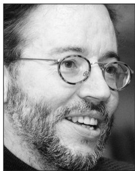
Af Rüdiger Schulze, Kiel

Min første reaktion var mildt sagt tøvende, da avisen spurgte, om jeg kunne forestille mig at skrive Ugerevyen. Nu, midt i valgkampens hede fase, hvor det gælder alle mand af huse og det helst hver eneste dag - da har vi dog vitteligt andet at lave end at skrive mere eller mindre spændende eller morsomme ugerevyer. Det går ikke! Men, som læseren allerede kan se, gik det alligevel.