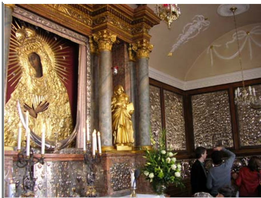
A városkapu kápolnájában a csodatevő festmény. A Vilnusi Madonna valóságos zarándokhely