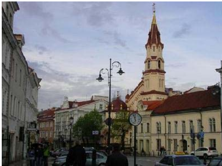
Utcakép Vilniusban. Valóban hangulatos a belváros