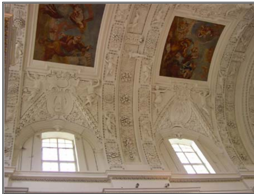
Szent Péter és Pál templomának stukkódíszítése lenyűgöző, kétezer figurát számolhat össze az, aki nem csak pusztán csodálni akarja