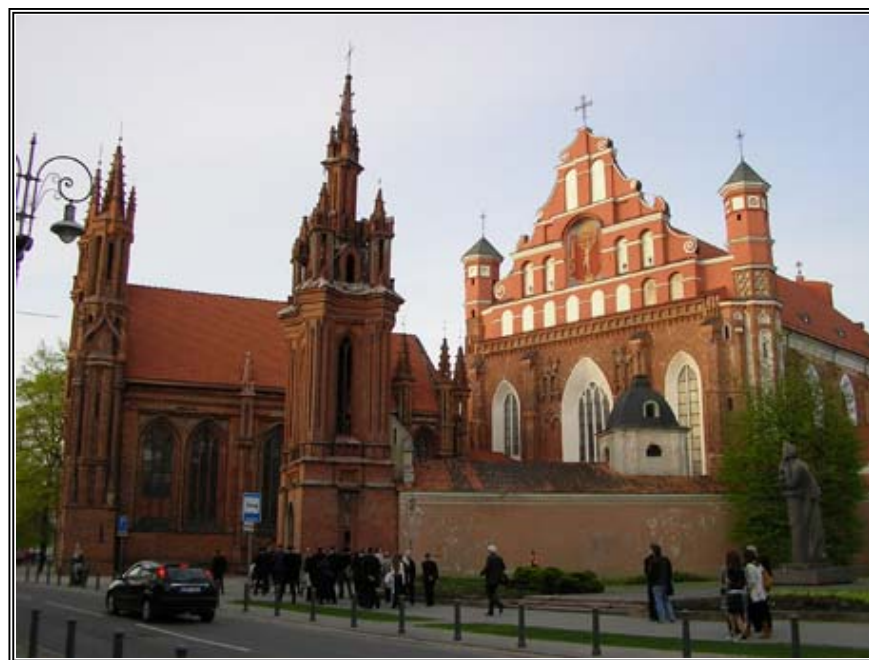
Templomok egymás hegyén-hátán. Hátul a Szent Bernardino, előtte (a kép bal szélén) a Szent Anna és (jobbra) a Szent Ferenc. A jobb sarokban Adam Mickiewicz szobra