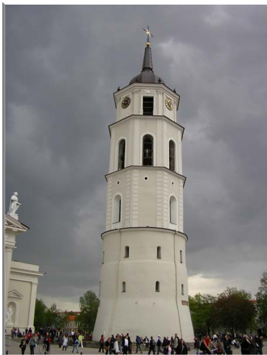
A katedrális harangtornya

Hozzá kell azonban tenni, hogy a kérdés tényleg nehéz, hiszen a Litván Köztársaságban meglehetősen kevés nagyváros van. Már csak azért is, mert az EU-hoz 2004-ben csatlakozott ország népessége nem éri el a 3,5 millió főt. S ha már a lakosságról beszélünk, tudni kell, hogy nemzetiségi szempontból Litvánia igen sokszínű, hiszen számos kisebbség él területén: elsősorban lengyelek (a lakosság 6 százaléka), oroszok (5%), fehéroroszkok (1,1%), tatárok, németek, ukránok, romák és más nemzetiségűek – a litvánok így „csak” mintegy 84%-os többségben vannak. Vallásilag is igen változatos az ország lakossága, bár ez esetben a többség fölénye még nagyobb: a lakosok 90%-a római katolikus, majd következnek a sorban az ortodoxok (nagyjából 5%), evangélikusok (3%), de akár muzulmánokkal is találkozhatunk az utcákon.