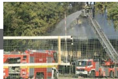
Tűz a fővárosi Művelődési és Pihenőpark (PKO) területén