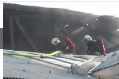
Tűz a PKO-ban