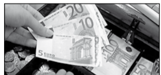
Csaltak, ezért tiltást kaptak

A cseh Capital Partners mostantól nem folytathat tőzsdei tevékenységet Románia területén – döntött a romániai Országos Tőkepiaci Felügyelet (CNVM). Mint ismeretes, a Capital Partners illegális ügyleteket folytatott, Magyarországon, kereskedelmi tevékenység látszatát keltve csapott be ügyfeleket és szerzett 3 milliárd forintot, ott emiatt számos vezetőjét elfogták. Romániában a Capital Partnersszel kapcsolatos vizsgálat már tavaly februárban megkezdődött, márciusban a tőzsdefelügyelet felhívta a cseh illetékes hatóság figyelmét a bróker cég jogszértő magatartására. A cseh hatóság ígérte, hogy kivizsgálja az ügyet, utóljára júniusban jelezte, hogy ez a vizsgálat folyamatban van. A romániai hatóságnak nincsenek adatai a romániai kár mértékéről.