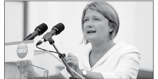
Gál Kinga EP-képviselő

Mint tegnap már bővebben beszámoltunk róla, az Európai Parlament kisebbségi frakciói csoportja szerdai ülésén a MIDAS (Kisebbségi és Regionális Nyelvű Napilapok Európai Egyesülete) vezetőivel találkozott. A MIDAS-nak lapunk is tagja. Az ülésen felszólt Tókes László EP-képviselő is. Az Európai Szabad Szövetség (EFA) volt képviselőjeként a kisebbségi jogok védelmében és az önkormányzati jogok melletti kiállításukért méltatta előző frakcióját. Közismert, hogy az EU ötszáz milliónyi polgára közül minden 7. vagy 8. valamely etnikai kisebbséghez tartozik – mondotta –, ez viszont távolról sem tükröződik az EP összetételében, valamint kisebbségi politikájában. Elismerését fejezte ki a tízéves szervezet munkája iránt, Tókes László a további kapcsolattartást javasolta, és arra kérte a kisebbségi sajtó képviselőit, hogy ezután a kisebbségügyi frakcióközi csoport tevékenységére az eddigieknél is jobban figyeljenek oda. A tanácskozás végén Gál Kinga EP-képviselő megköszönte a MIDAS eddigi tevékenységét kisebbségi jogok terén, arra kérve a szervezet tagjait, hogy rendszeresen forduljanak az Európai Parlamenthez, hiszen az EP az egyik legmegfelelőbb európai uniós intézmény, amely határozottan támogatja az emberi jogok védelmét.