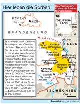
Hier leben die Sorben. Das Territorium, in dem die Sorben leben. Die Sorben sind ein autochthones Volk, das von Deutschland anerkannt ist und Anspruch auf Schutz und Förderung seiner Identität hat.

Der Hand und die Länder Sorben und Brandenburg streifen seit Jahren, vor für die Finanzierung der Stiftung für das sorbische Volk zuständig ist, obwohl diese Stiftung von Juni 1991 errichtet wurde, ein „einzigartig sorbische Kultur-, Bildungs- und Wissenschaftsinstitutionen zu erhalten.“