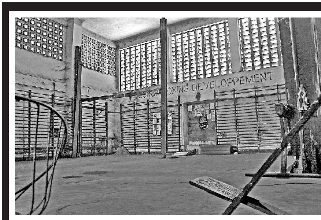
LUGARES IRREPETIBLES Sala na que adestrou Ali antes do combate

e decide cambiar o nome do país. O Congo convértese no Zaire. Mobutu preguntase como dar a coñecer este "novo" país. Ali convértese nun instrumento de comercialización. Estes dous homes totalmente opostos encóntranse sobre un punto: volverlle dar a súa dignidade ó home negro e así converterse en iconas mesmo do terceiro mundo. O combate permitirá promover Zaire (o ex Congo belga) en todo o mundo. O cartel do combate anuncia a cor: "Un encontro entre dous Negros, nun país negro, organizada por Negros e esperado polo mundo enteiro: ¡É aquí unha vitoria do mobutismo!". Para facer vir os dous campións ó centro de África, o home do pucho de leopardo non vai reparar en gastos. As televisións americanas esixen que o partido se retransmita en directo. Isto farase, a pesar dos gastos exorbitantes que iso implica. Para poder desprazar a todos os xornalistas, Mobutu readquire o conxunto de autobuses do mundial de fútbol de 1974 en Alemaña. "De feito, para o país é o principio da bancarrota" insiste a Kabala. O diñeiro non conta. O pobo paga. Só a