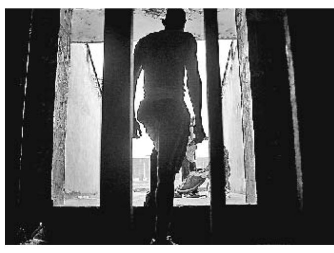
DANADO POLO PASO DO TEMPO Un boxeador entrando no mítico estadio da capital do Congo