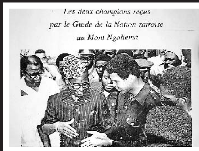
ANTES DO COMBATE Mobutu, xefe do Estado do Zaire, saudando a Ali