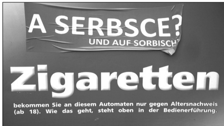
És szorbul? – kétnyelvűséget követelő matrica, ezúttal egy cigarettá-automatán

kedtek, hanem előzékenyen, jóhiszeműen „megkóstoltatták” azt a németekkel is.