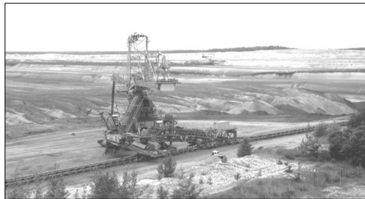
Termőfölddel fedik le a tájon ejtett sebet

A városban hírhedt börtön állt, a neve Sárga nyomorúság (Gelbes Elend) volt. Akinek nem tetszett a rendszer, könnyen oda kerülhetett anélkül, hogy a családját tájékoztatták volna a bebörtönözéséről.