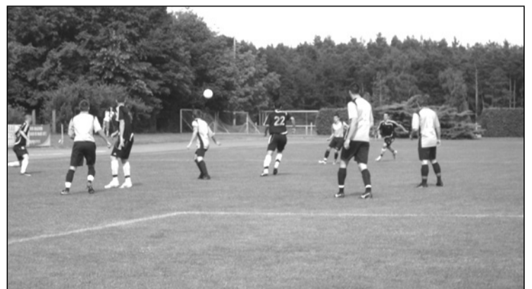
Két magyarországi kisebbség mérkőzik: romák a szlovákok ellen

A csoportmérkőzések végén kulturális estet szerveztek a házigazdák, amelyen a kisebbségek nemzeti sajátosságait mutatták be. A MIDAS-csoportnak ez volt a búcsúestje, és az elkészítés néhány pohár sörében a viszatérés ígérete is benne volt.