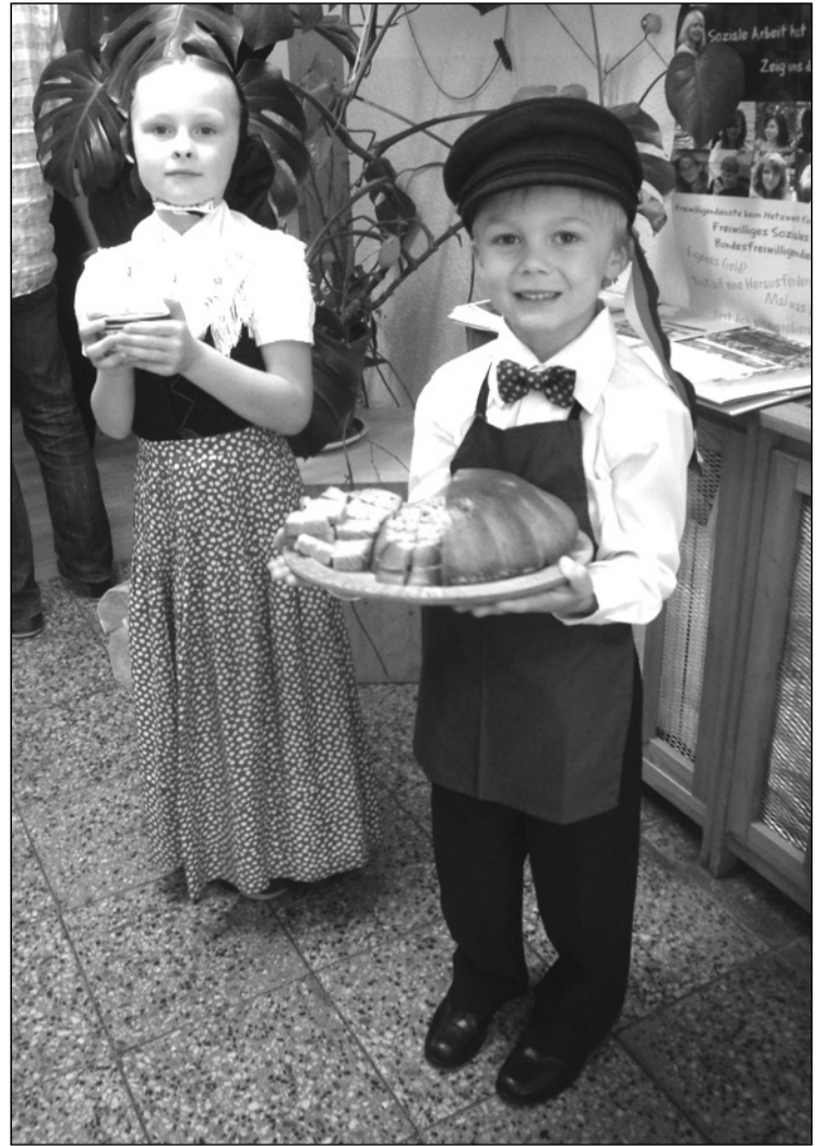
Croswitzki óvodások szorb népviseletben vártak bennünket