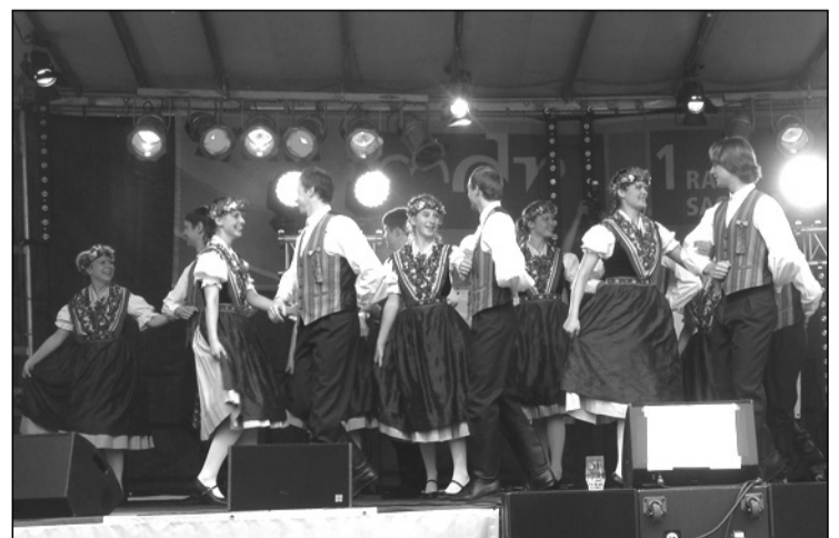
Táncsal, zenével, sörrel búcsúztunk a szorboktól