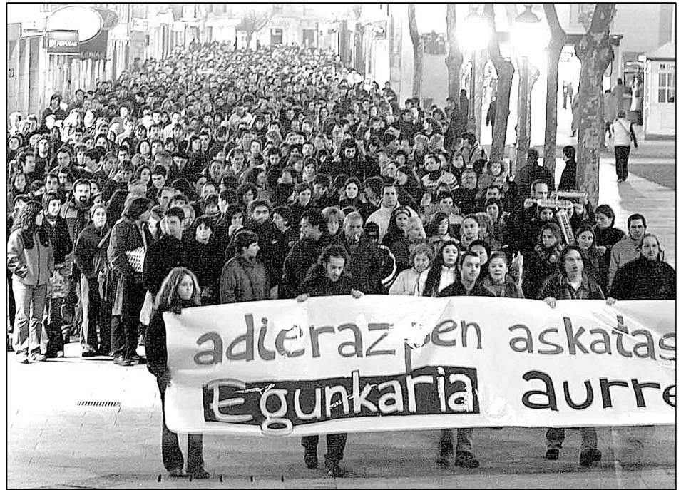
Milers de persones es manifestaren abir als carrers de Vitòria contra el tancament del diari i com a mostra de solidaritat amb els detinguts i treballadors.