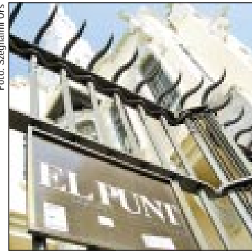
Székhelyüket Gaudí tervezte

tanában nem termel profitot. Ezért kicsit túlzás volt, amikor a lap vezetői – vélt tájékoztatásunkra alapozva – a lapismertető során azt állították: az egész Katalónia legnagyobb