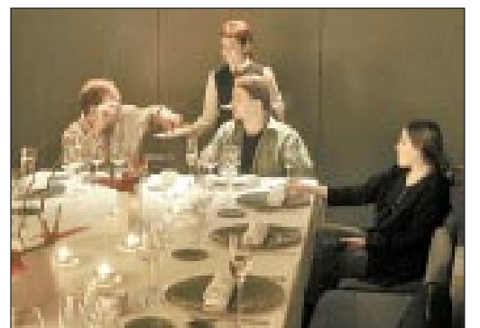
Estebéd egy belvárosi lokálban