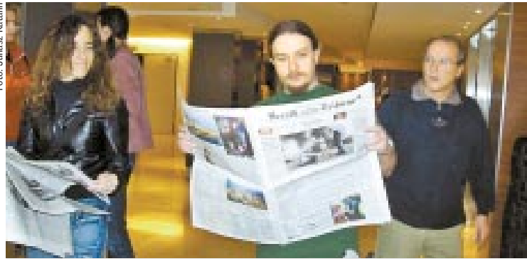
A csapat tagjai az angol nyelvű sajtóból informálódtak a hét során

Az El Punt példányszáma a Bihari Naplóénak körülbelül a kétszerese – igaz, hogy a Gironában szerkesztett kiadványt a mienknél nagyobb területen is terjesztik. Enric Serra, a küldöttséget vendégül látó lap kiadójának vezérigazgatója elmondta: természetesen ők is a Franco-diktatúra megszűnte után indultak, amíg ugyanis a diktátor életben volt, nemhogy a katalánok sajtója „nem bontható szárnyat”, de e nemzeti közösség állandó terrornak és el-