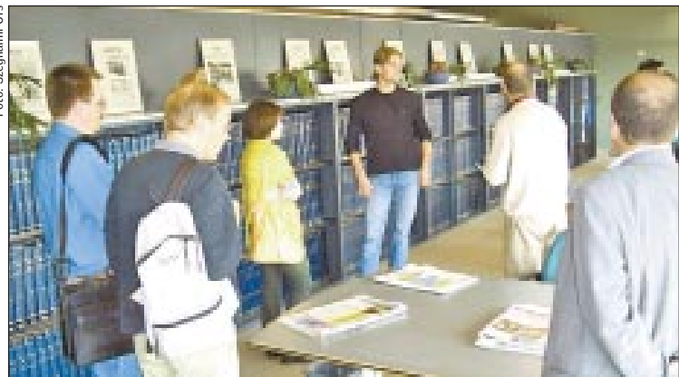
Az El Punt archívuma egy emeletnyi helyet foglal el

nyomásnak volt kitéve. Ehhez képest igen hamar magukra találtak, hiszen (mint minisorozatunk olvasóinak arról már fogalmuk lehet) Katalóniában ma már számos médium működik. Összesen öt kisebb-nagyobb regionális napilap jelenik meg (mi csak a legnagyobbakat kerestük fel ottlétünkör), emellett számos periodikájuk, valamint rádió- és tévéadójuk is van.